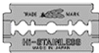
ベビーフリーハンドナイフ替刃