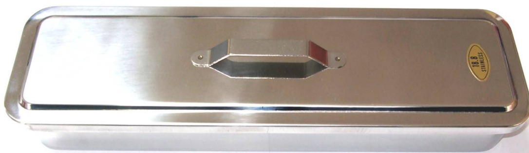
キャリングケース(ベビー用)