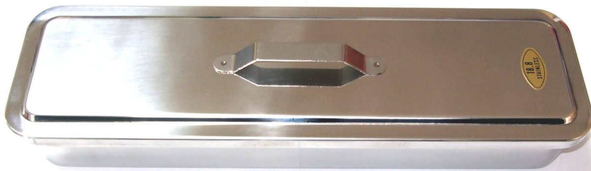
キャリングケース