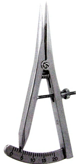
カストロカリパー