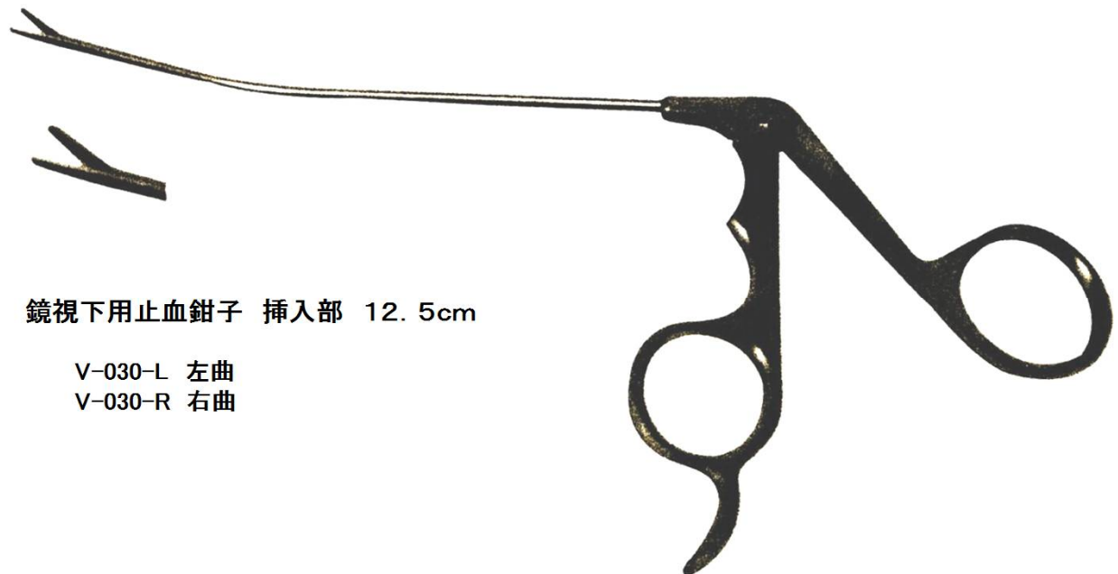
鏡視下用止血鉗子 挿入部 12.5cm