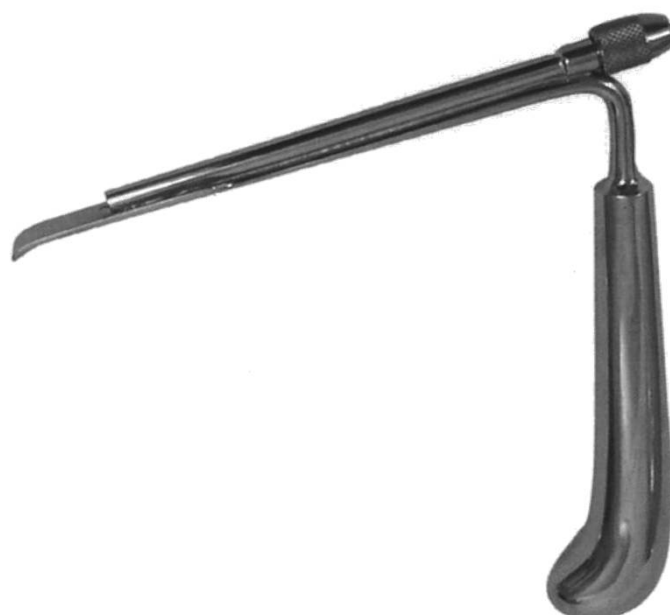
鏡視下用レトラクター