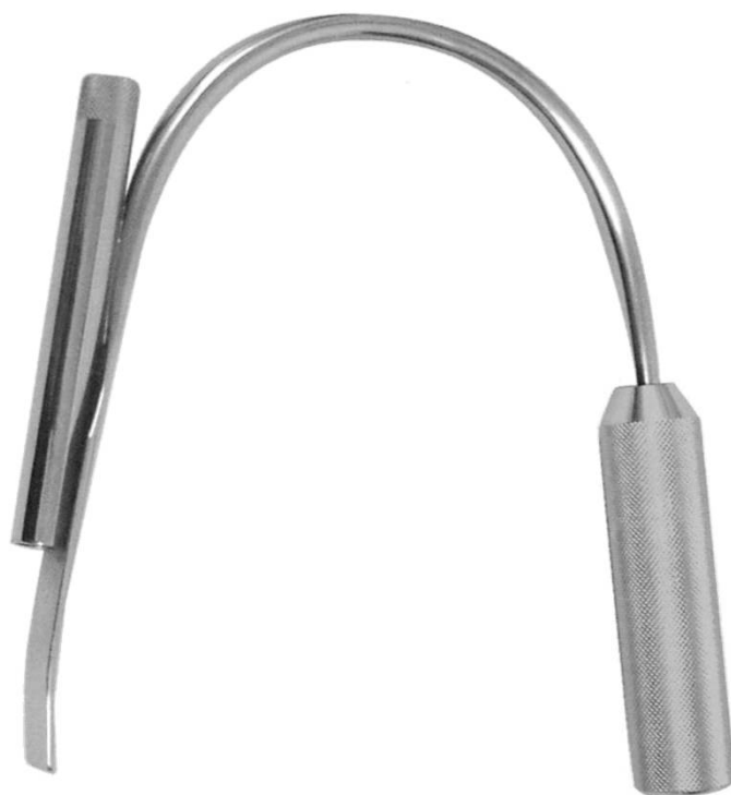
鏡視下用マンマリーレトラクター