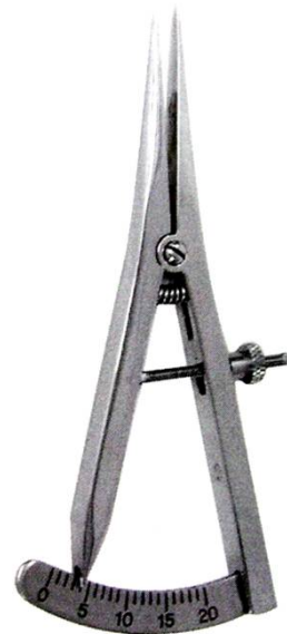
カストロカリパー