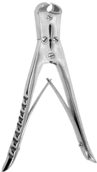
二連ピンカッター 18cm T-110-18