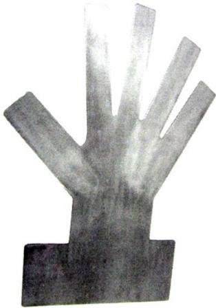
手形板(ステンレス) T-100-00